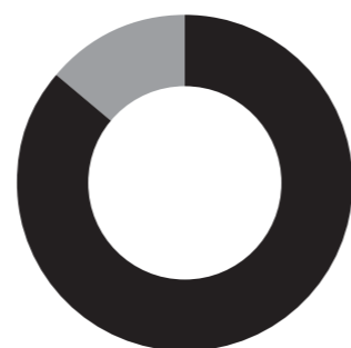
Finanzierung der Beiträge und Vergabungen 2023 aus ■ Verein GGG und ■ Stiftungen