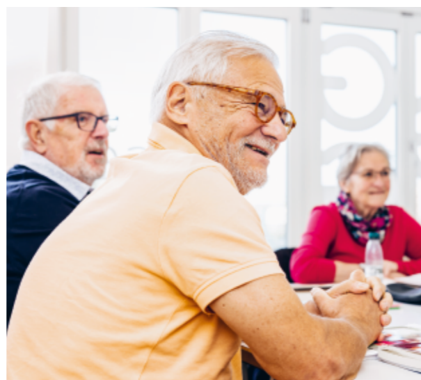
Gemeinsam lernen im GGG Kurs