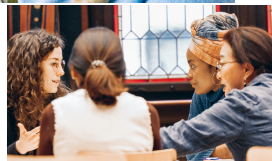
Gemeinsam Veränderungen anstossen mit der GGG Migration

Auch innovative Projekte wie das Begleitangebot Tram-dem von GGG Benevol zeigen, wie niederschwellige Unterstützung Einsamkeit wirksam lindern kann.