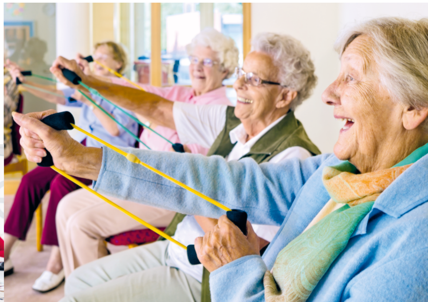
Gemeinsam aktiv sein in der GGG Alterssiedlung Bläsistift

E insamkeit ist heute ein weitverbreitetes Gefühl. Einfach erklärt, entsteht Einsamkeit, wenn die eigenen sozialen Beziehungen nicht so sind, wie man sie sich wünscht. Wobei dabei nicht zwingend die Anzahl Begegnungen ausschlaggebend sind, sondern deren Qualität in Bezug auf unsere Erwartungen.